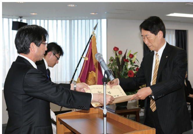
仙台市消防局受領