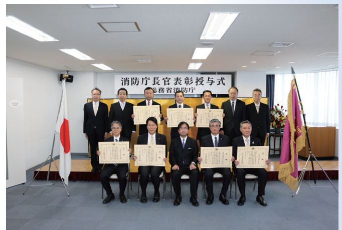
台風第10号による災害に出動した皆様