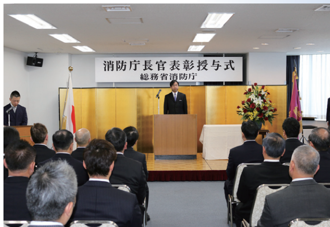
挨拶を述べる青木長官