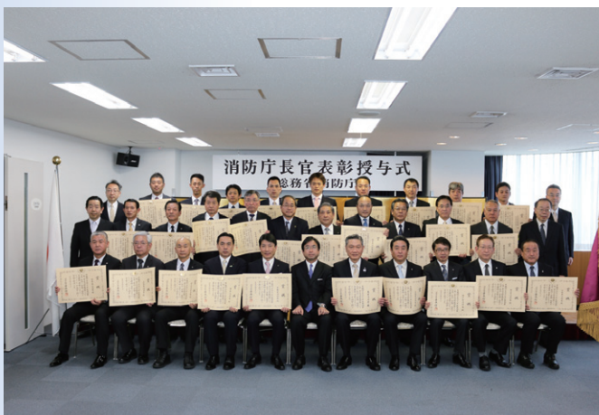
平成28年熊本地震に出動した皆様